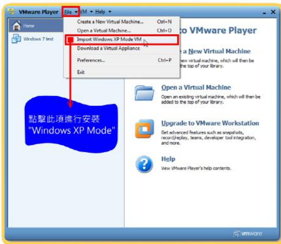
圖示 (一) 載入 XP Mode

4. >> 在 VMware player > File > 單擊 Import Windows XP Mode VM 載入 XP Mode 載入過程大約 5~10 分鐘即可完成建立虛擬 XP 系統。